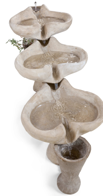
Mémeau | Jean-Marc Fassel © Jean-Marc Baudet