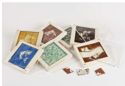
Zle ? | Cyril Micol