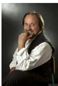
Jean-Marc Fassel Artiste sculpteur et fondeur d'art