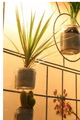
Vitrail végétal | Cyril Micol © ASF