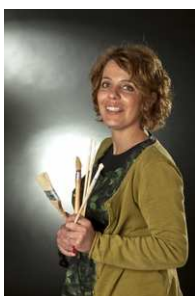
Sandrine Rongier Peintre en décor du patrimoine © Jean-Marc Baudet