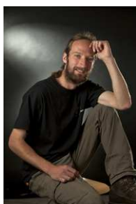
Cyril Micol Maître-verrier