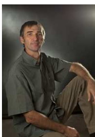
Claude Gros Ebéniste © Jean-Marc Baudet