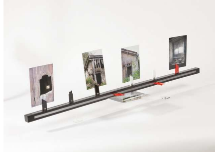
Izifoto | Martine Dotto © Jean-Marc Baudet

Pour la scénographie : des stands individuels pour un effet « showroom ».