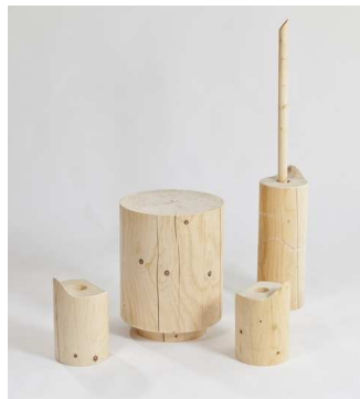
Sièges d'appoint et tables Pose ' Nature | Benoît Jaillet

Les coulisses se dévoilent... les artisans aussi !