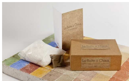
La Boîte à Chaux | Sandrine Rongier © Jean-Marc Baudet