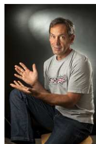
Benoît Jaillet Sculpteur © Jean-Marc Baudet