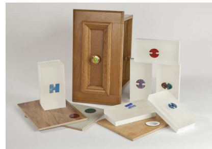
Emaux boutons | Dominique Morelli