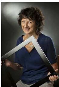
Martine Dotto Encadreur d'art