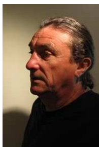
Raymond Guibert Potier © RG